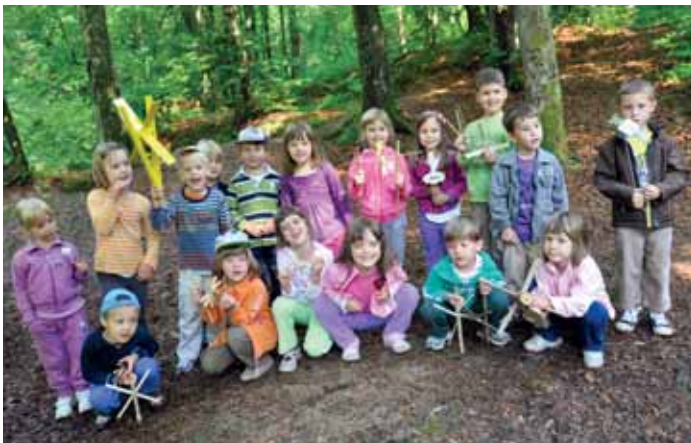
Otroci iz vrtca Črnuče