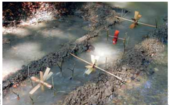
Mlinčki na Črnušnici

Poleg tradicionalnih dejavnosti kot sta postavljanje mlinčkov in hoja po slepi stezi so bile predstavljene tudi ostale zanimivosti gozdov znotraj in izven meja naše domovine. Obiskovalci so ponovili znanje gozdnega bontona, ustvarjali v gozdni galeriji, spoznavali vlogo gozdarja in lovca ter uživali v gozdnih vonjih. Ogleдали so si gozdne škodljivce, ptice v gozdni krajini, živali. Naučili so se, kako se odčita višina drevesa z višinomedom ter katere izdelke vse lahko izdelamo iz lesa. Ob manjšem ognju so otroci ugotavljali, kakšne vrste lesa gorijo in hkrati izpostavili nevarnost ognja v gozdu.