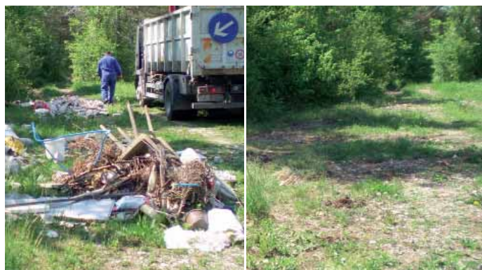
Stanje pred in po čistilni akciji.