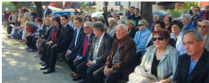
Udeleženci letošnje proslave so bile tudi delegacije iz drugih občin in četrtnih skupnosti ter krajanji Črnuč, skupaj več kot 200.

V sredo 20. aprila se je pred državnim praznikom dnevu upora proti okupatorju in v počastitev dneva ustanovitve Rašiške čete, v parku sedmih Narodnih herojev pred osnovno šolo narodnega heroja Maksa Pečarja v Črnučah, zbrala velika množica ljudi različnih starosti.