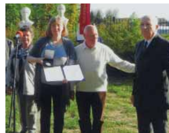
Srebrno plaketo republiške zveze za vrednote NOB, je prejela osnovna šola Dragomelj.