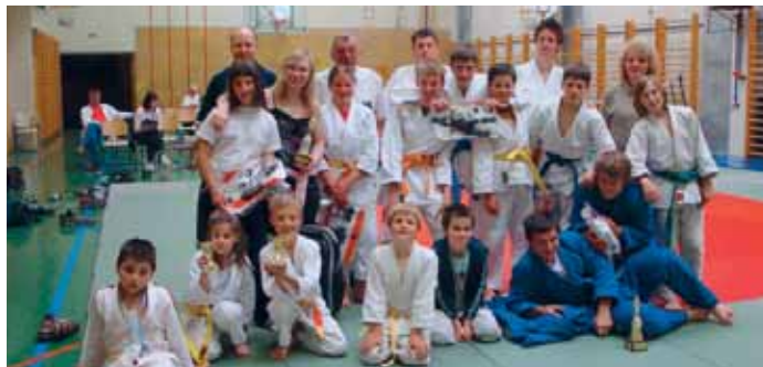
Bodoči šampioni na blazinah.

V sklopu prireditev “Črnuška pomlad 2011”, se bodo v judo borbah pomerili tudi najmlajši judoisti. Športno društvo Polyteam, ki letos praznuje 15. obletnico delovanja, bo že četrto leto zapored organiziralo tekmovanje, ki se ga bodo poleg domačih tekmovalcev iz cele Slovenije, udeležili tudi gostje iz tujine.